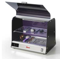
Vista UVC SH