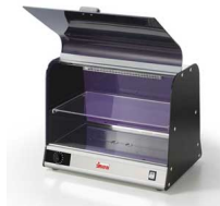
Vista UVC SH