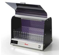
Vista UVC 24W SH con supporto tablet e smartphone opzionale