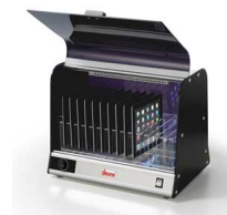
Vista UVC 24W SH con supporto tablet e smartphone opzionale